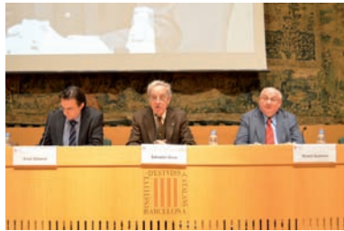
FOTOGRAFIA 9. Inauguració de les Segones Jornades sobre la Gestió de la Informació Científica a la Sala Prat de la Riba de l'IEC.