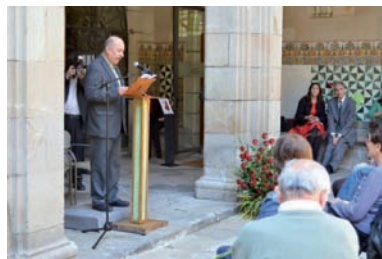
FOTOGRAFIA 13. Lectura pública de Lo somni de Bernat Metge al claustre de l'IEC durant la Diada de Sant Jordi.