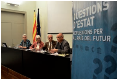
FOTOGRAFIA 16. Presentació oficial del cicle «Qüestions d'estat. Reflexions per al país del futur», organitzat per l'Institut d'Estudis Catalans i Òmnium Cultural.