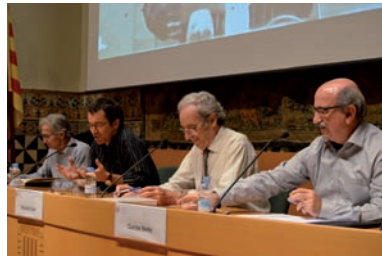
FOTOGRAFIA 4. Jornades d'homenatge a Josep Ferrater Mora a la Sala Prat de la Riba.