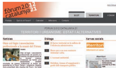
FOTOGRAFIA 10. Lloc web Fòrum 2012 Catalunya 21 Territori i Urbanisme .