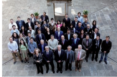
FOTOGRAFIA 12. Guardonats amb els Premis Sant Jordi.