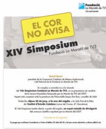
FOTOGRAFIA 17. Invitació al XIV Simposium Fundació La Marató de TV3.