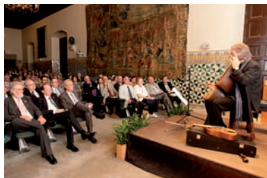
FOTOGRAFIA 1. Actuació musical de Jordi Savall a la Sala Prat de la Riba en la clausura de l'acte d'inauguració del curs 2012-2013.