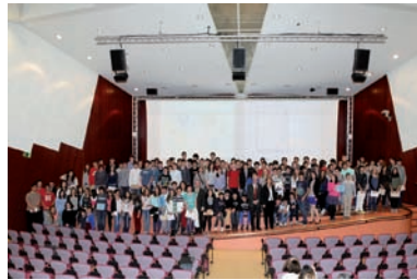
FOTOGRAFIA 15. Guardonats amb els premis de les Proves Cangur.